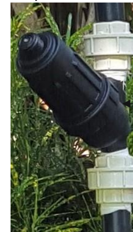
Coraza o cuerpo dentro del cual se encuentra el filtro

Para ello, se cerrará la llave general, que se encuentra antes del filtro, se desenrosca la tapa de la coraza o cuerpo dentro del cual se encuentra el filtro, luego con un simple estirón se retirará el el filtro, y luego se enjuagará con abundante agua a presión y si es necesario con la ayuda de un cepillo.